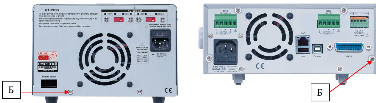
Рисунок 2 - Вид задней панели источников, место пломбировки от несанкционированного доступа (Б)