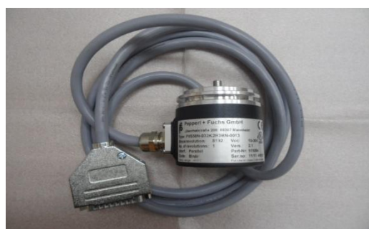
Рисунок 5 - Датчик угла FVS58