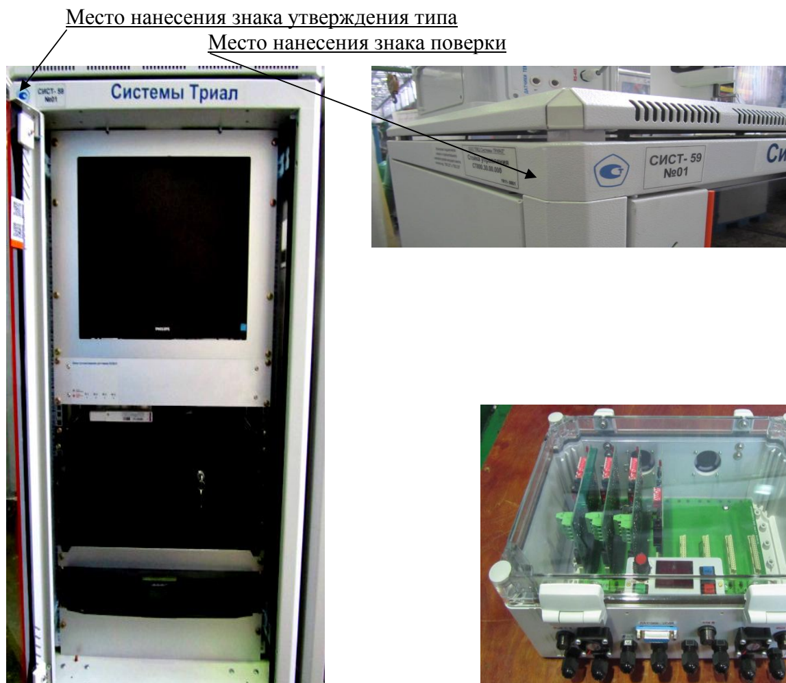
Рисунок 1 - Общий вид стойки управления