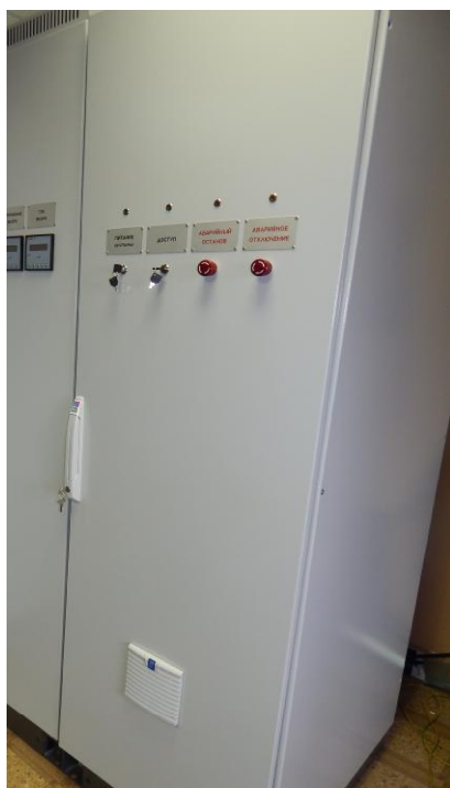
Рисунок 1 - Внешний вид шкафа центрального ИК ЧВ АСУ ЦУ

Внешний вид преобразователя частоты вращения ЛИР-390А представлен на рисунке 3.