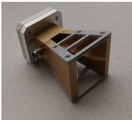
а) со стороны ВЧ соединителя

Внешний вид антенны DRH67 приведен на рисунках 1 и 2.