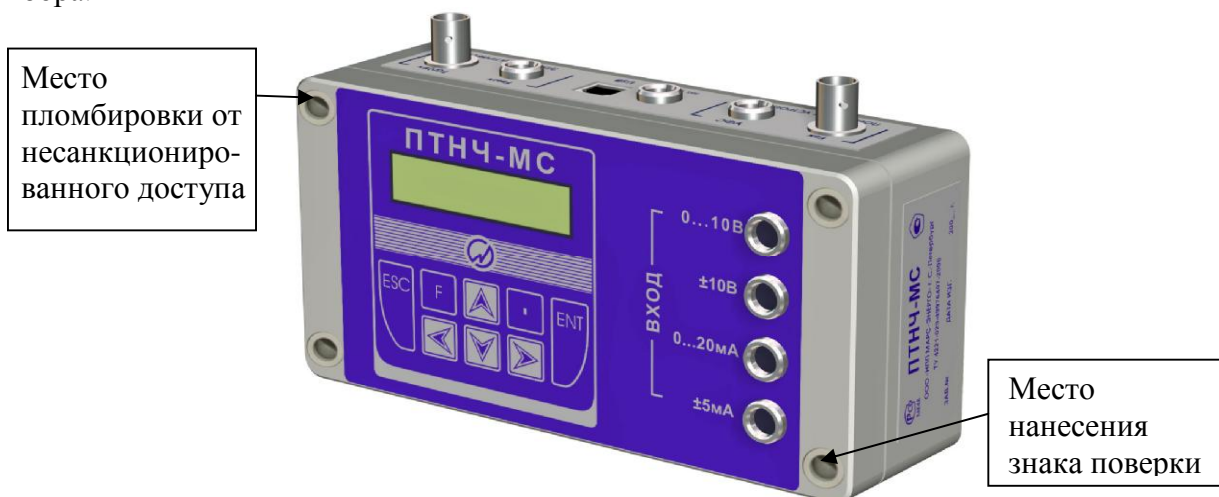
Рисунок 1 - Общий вид Приборов модификаций ПТНЧ-МС, место пломбировки от несанкционированного доступа и обозначение места нанесения знака поверки

Общий вид приборов, место пломбировки от несанкционированного доступа и обозначение места нанесения знака поверки представлены на рисунках 1 - 3. Пломбирование комплектов осуществляется в виде пломбы в гнезде крепежного винта крепления крышки прибора.