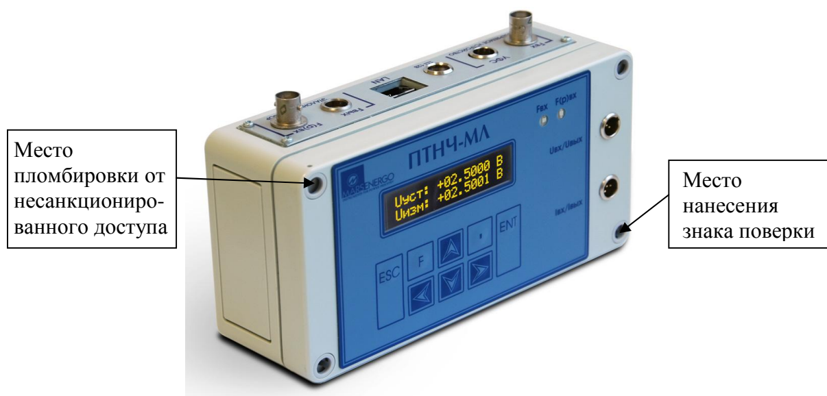
Рисунок 2 - Общий вид Приборов модификаций ПТНЧ-МЛ, место пломбировки от несанкционированного доступа и обозначение места нанесения знака поверки