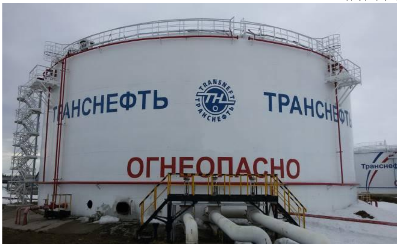
Рисунок 2 – Общий вид резервуара вертикального стального цилиндрического РВС-10000