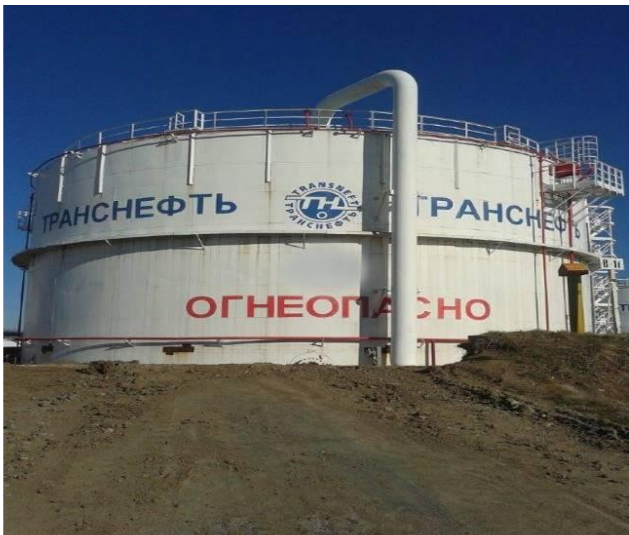
Рисунок 1 – Общий вид резервуара вертикального стального цилиндрического РВС-5000

Общий вид резервуаров вертикальных стальных цилиндрических РВС-5000, РВС-10000, РВС-20000, РВСП-20000 представлен на рисунках 1, 2, 3, 4.