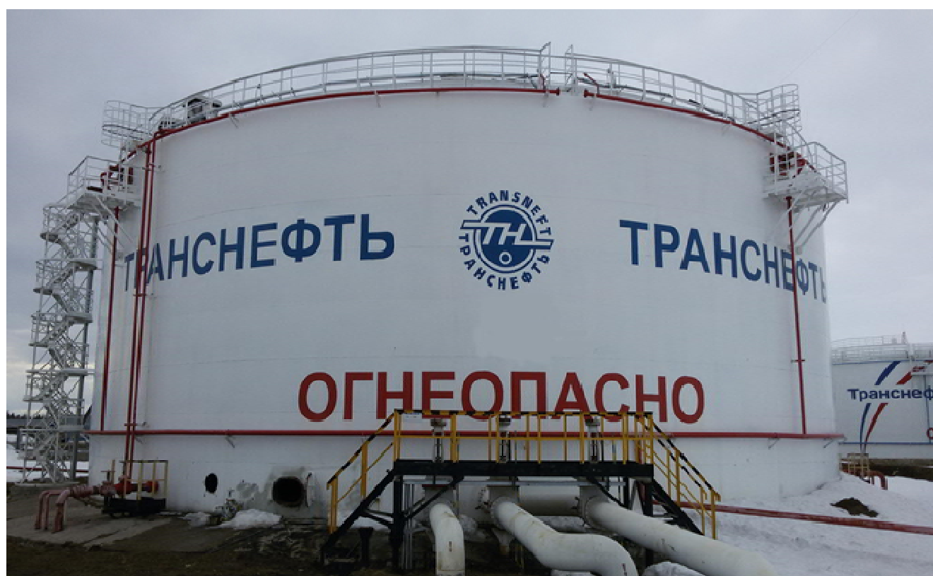
Рисунок 3 – Общий вид резервуара вертикального стального цилиндрического РВС-20000