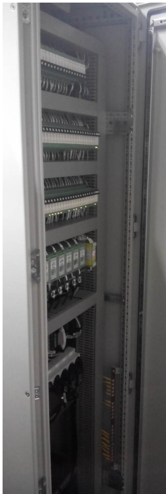
Рисунок 2 - Шкаф приборный (вид сзади)