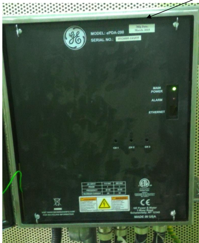
Рисунок 2 - Общий вид блока сбора данных