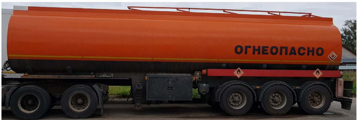
Рисунок 1 - Общий вид полуприцепа-цистерны OZGUL OZG02 T22

Схема пломбировки для защиты от несанкционированного изменения положения указателя уровня налива, обозначение места нанесения знака поверки представлены на рисунке 2.