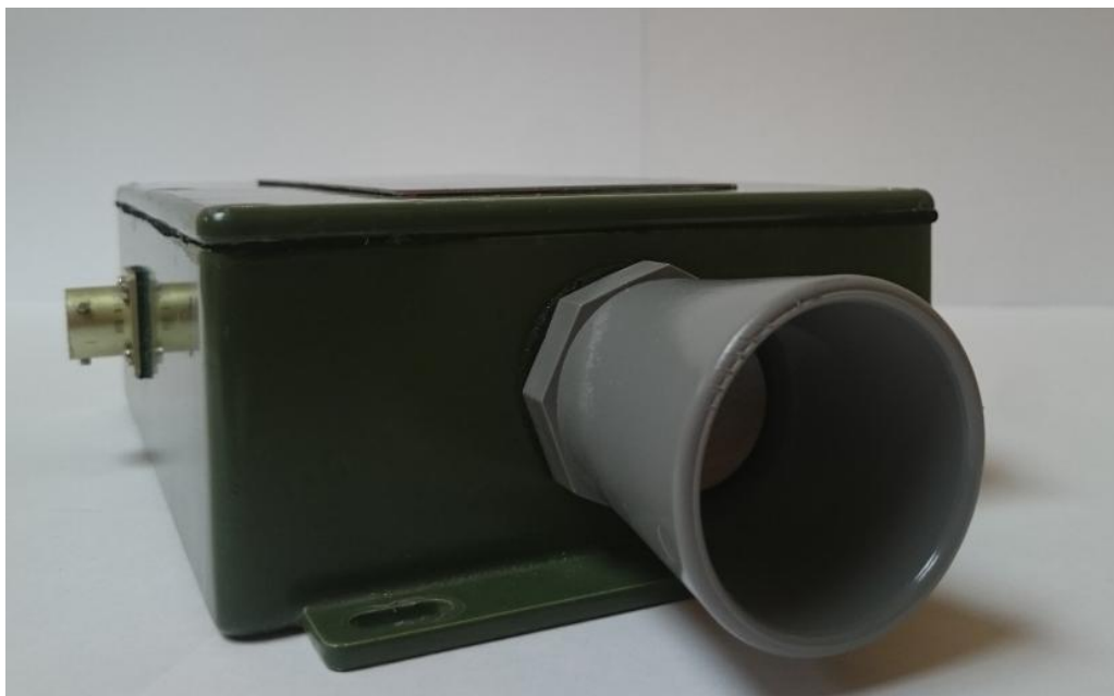
Рисунок 1 – Внешний вид датчика ультразвукового АДБР.412168.072.410.195.00

Схема пломбировки от несанкционированного доступа представлена на рисунке 2.