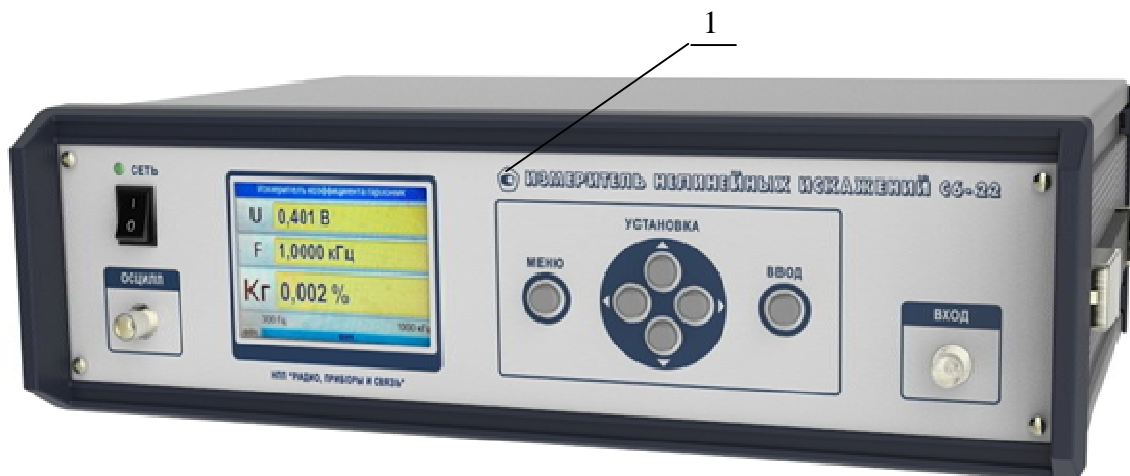
позиция 1 – место размещения знака утверждения типа

Общий вид приборов с указанием места размещения знака утверждения типа, приведен на рисунке 1.