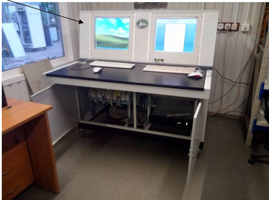
Рисунок 1 - Общий вид пульта управления и отображения