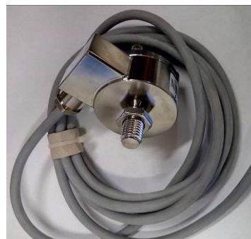
Рисунок 4 - Датчик силоизмерительный тензорезисторный 1-U2B/1,0KN