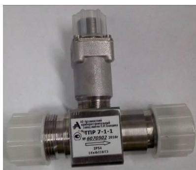
Рисунок 7 - Преобразователь расхода турбинный ТПР7-1-1