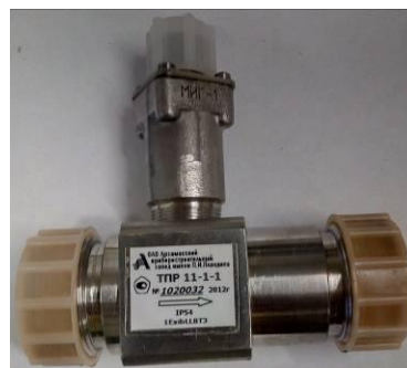
Рисунок 6 - Преобразователь расхода турбинный ТПР11-1-1