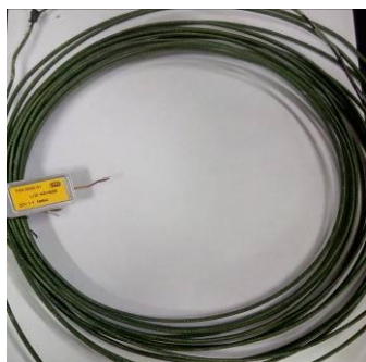
Рисунок 5 - Преобразователь термоэлектрический ТХК-0292-01-10000