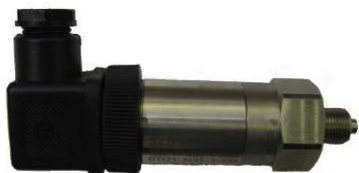
Рисунок 3 - Преобразователь давления измерительный СДВ-И