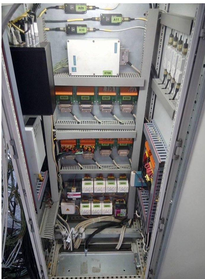
Рисунок 2 - Общий вид шкафа коммутационный