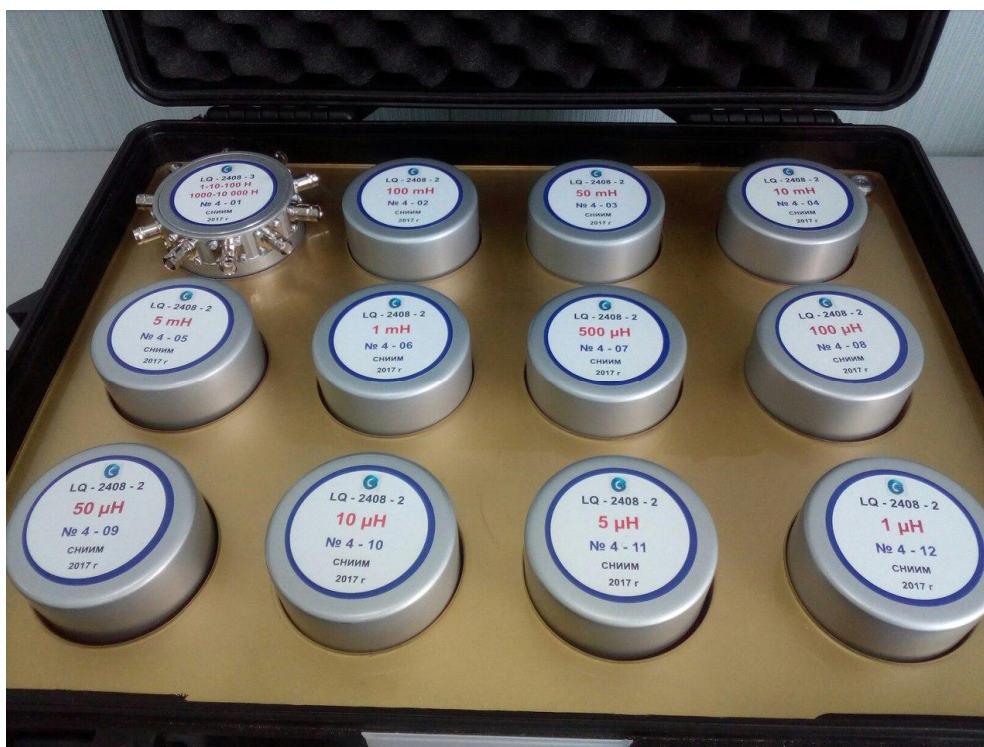
Рисунок 1 - Общий вид набора рабочих эталонов

Схема пломбировки эталона от несанкционированного доступа, обозначение места нанесения знака поверки представлены на рисунке 4.