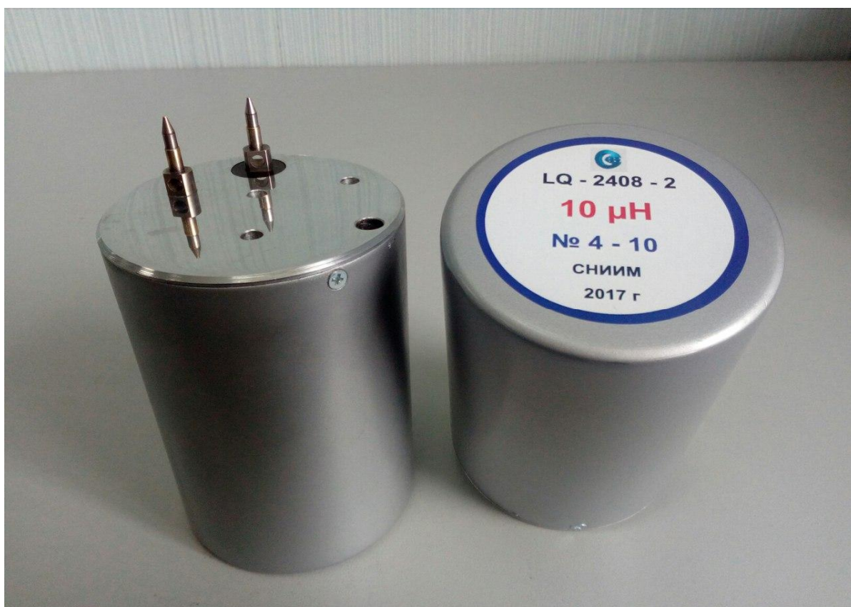
Рисунок 2 - Общий вид эталона LQ-2408-2