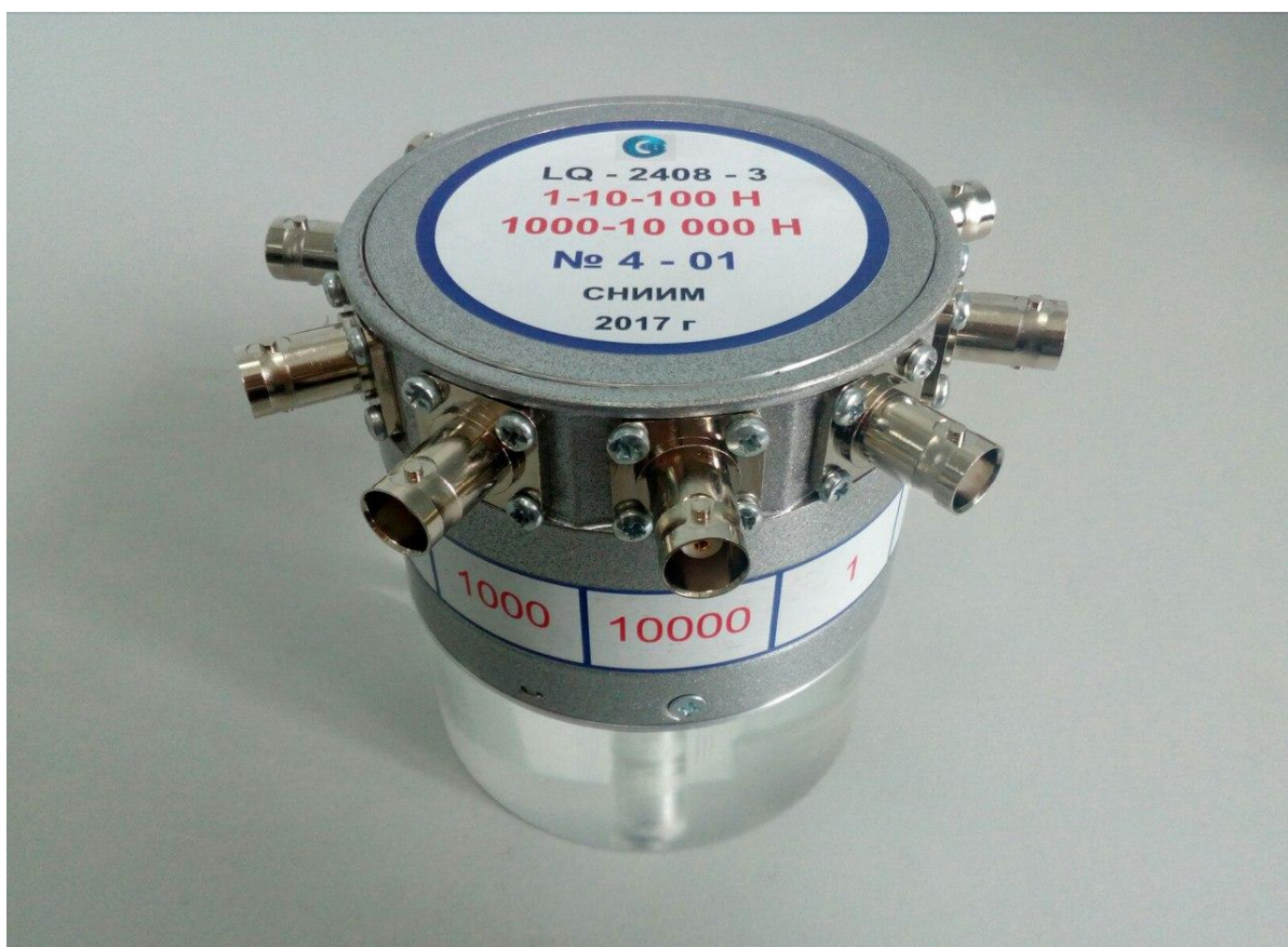
Рисунок 3 - Общий вид эталона LQ-2408-3