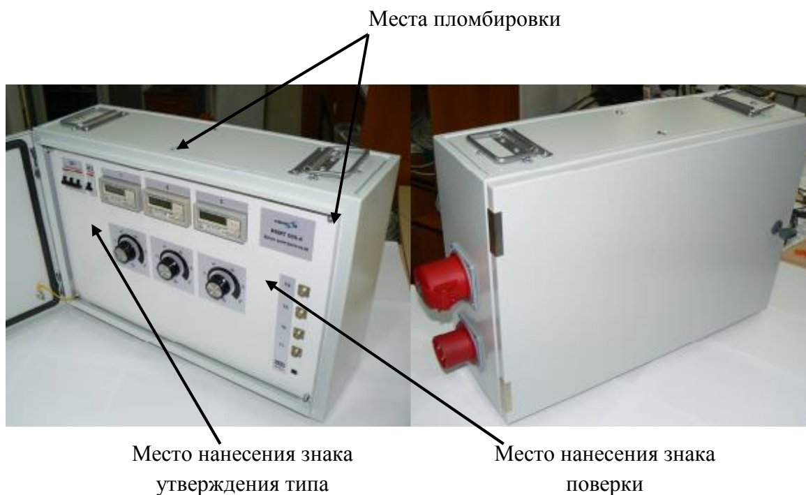
Рисунок 1 - Общий вид центрального блока

Общий вид комплекса, места пломбировки от несанкционированного доступа, места нанесения знака утверждения типа и знака поверки представлены на рисунках 1-2.