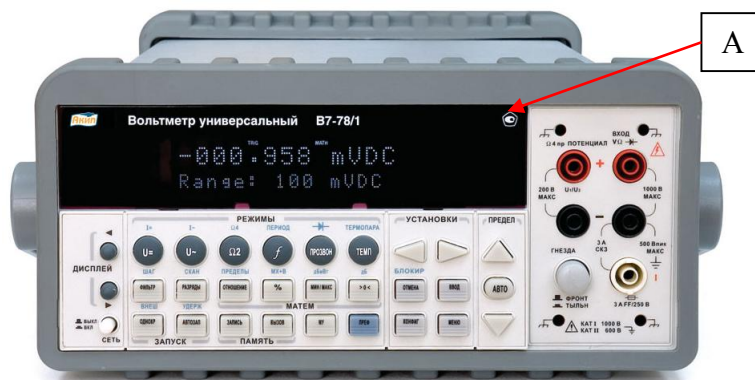
Рисунок 1 - Внешний вид вольтметров В7-78/1 и место нанесения знака утверждения типа (А)

Внешний вид вольтметров представлен на рисунках 1, 2, 3. На рисунке 4 приведена схема пломбировки от несанкционированного доступа. Пломбировка наносится на один из крепежных винтов на задней панели вольтметров.