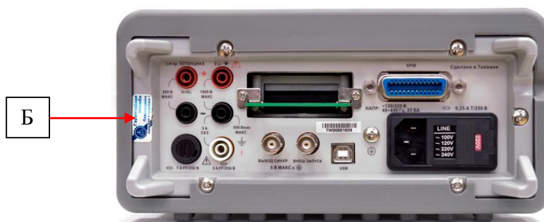
Рисунок 4 - Схема пломбировки от несанкционированного доступа (Б)