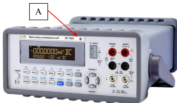
Рисунок 2 - Внешний вид вольтметров В7-78/2 и место нанесения знака утверждения типа (А)