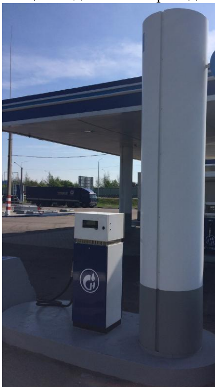
«Quantium» модель 100Т

Общий вид колонки приведен на рисунке 1, места пломбирования на рисунках 2 – 3.