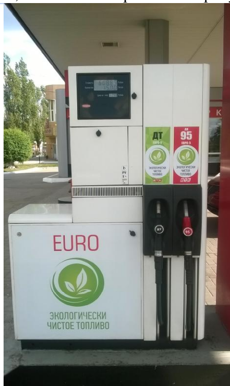
«Quantium» модель 500Т