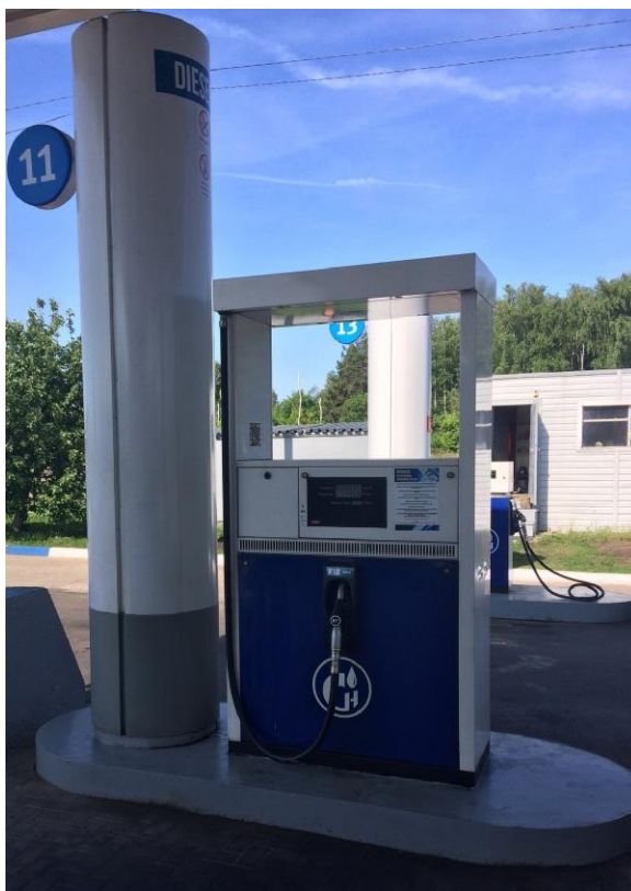
Рисунок 1 - Общий вид колонки

Общий вид колонки приведен на рисунке 1, места пломбирования на рисунках 2 - 3.