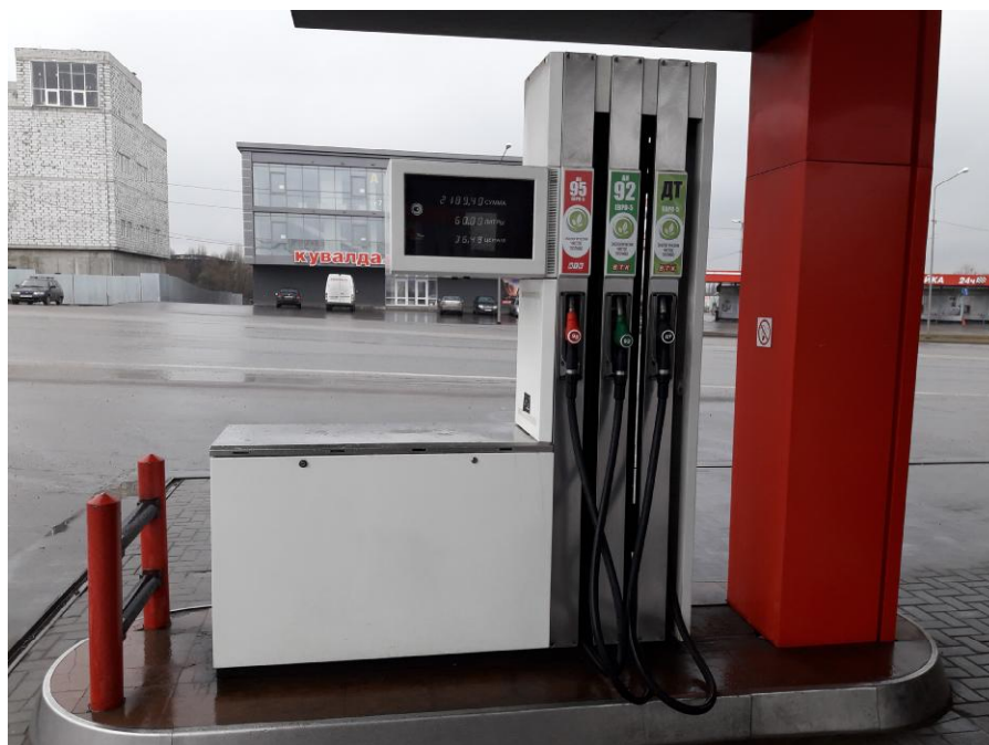
Рисунок 1 – Общий вид колонки

Общий вид колонки приведен на рисунке 1, места пломбирования на рисунках 2 – 3.