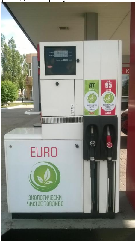
Рисунок 1 – Общий вид колонки

Общий вид колонки приведен на рисунке 1, места пломбирования на рисунках 2 – 3.