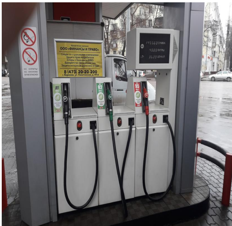
Рисунок 1 – Общий вид колонки

Общий вид колонки приведен на рисунке 1, места пломбирования на рисунках 2 – 3.