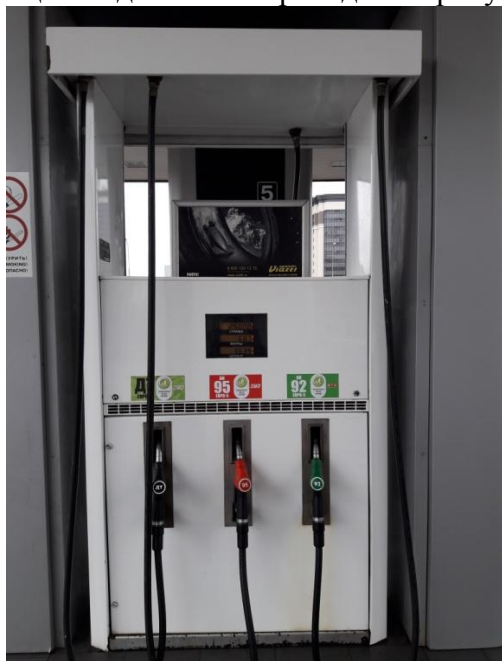
заводские номера 062, 060

Общий вид колонки приведен на рисунке 1, места пломбирования на рисунках 2 – 3.