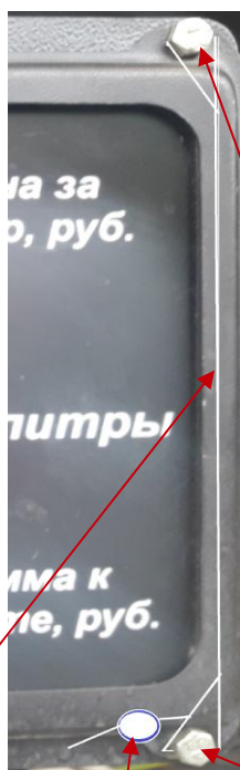
Пломбировочная проволока Пломба поверителя ( 1 шт.) Пломбировочные болты