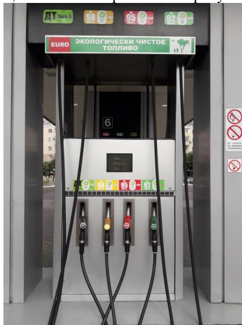
заводские номера 006, 008, 007