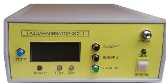
Рисунок 2 - Фотография внешнего вида газоанализатора ФСГ исполнение ФСГ-2