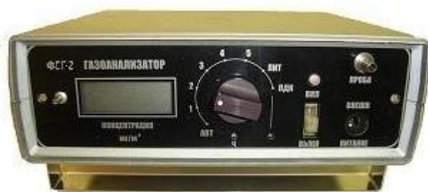
Рисунок 1 - Фотография внешнего вида газоанализатора ФСГ исполнение ФСГ-1

Пломбирование газоанализаторов осуществляется методом установки контрольных пломбирочных несъемных наклеек-стикеров на крепежный винт крышки корпуса прибора (рис.5).