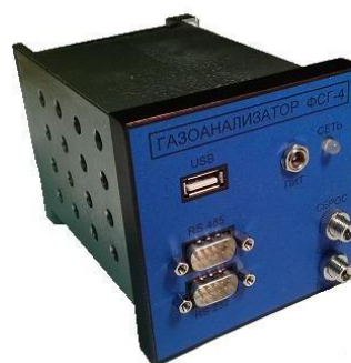
Рисунок 4 - Фотография внешнего вида газоанализатора ФСГ исполнение ФСГ-4