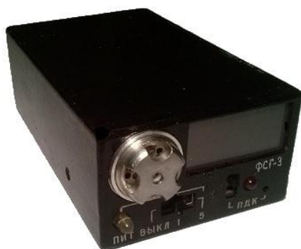
Рисунок 3 - Фотография внешнего вида газоанализатора ФСГ исполнение ФСГ-3