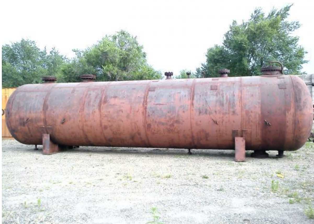
Рисунок 8 – Общий вид резервуара стального горизонтального цилиндрического РГС-63