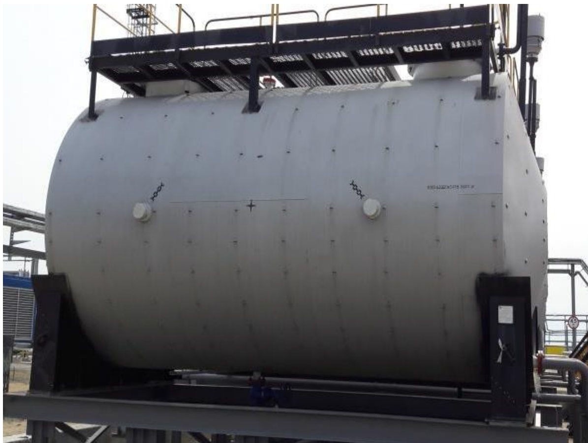
Рисунок 5 – Общий вид резервуара стального горизонтального цилиндрического РГС-25