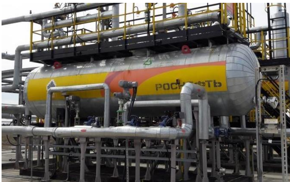
Рисунок 4 – Общий вид резервуара стального горизонтального цилиндрического РГС-12,5