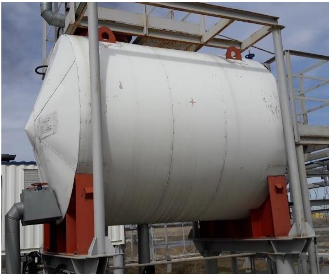
Рисунок 3 – Общий вид резервуара стального горизонтального цилиндрического РГС-10