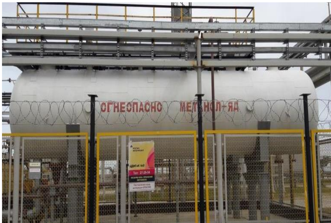
Рисунок 7 – Общий вид резервуара стального горизонтального цилиндрического РГС-50