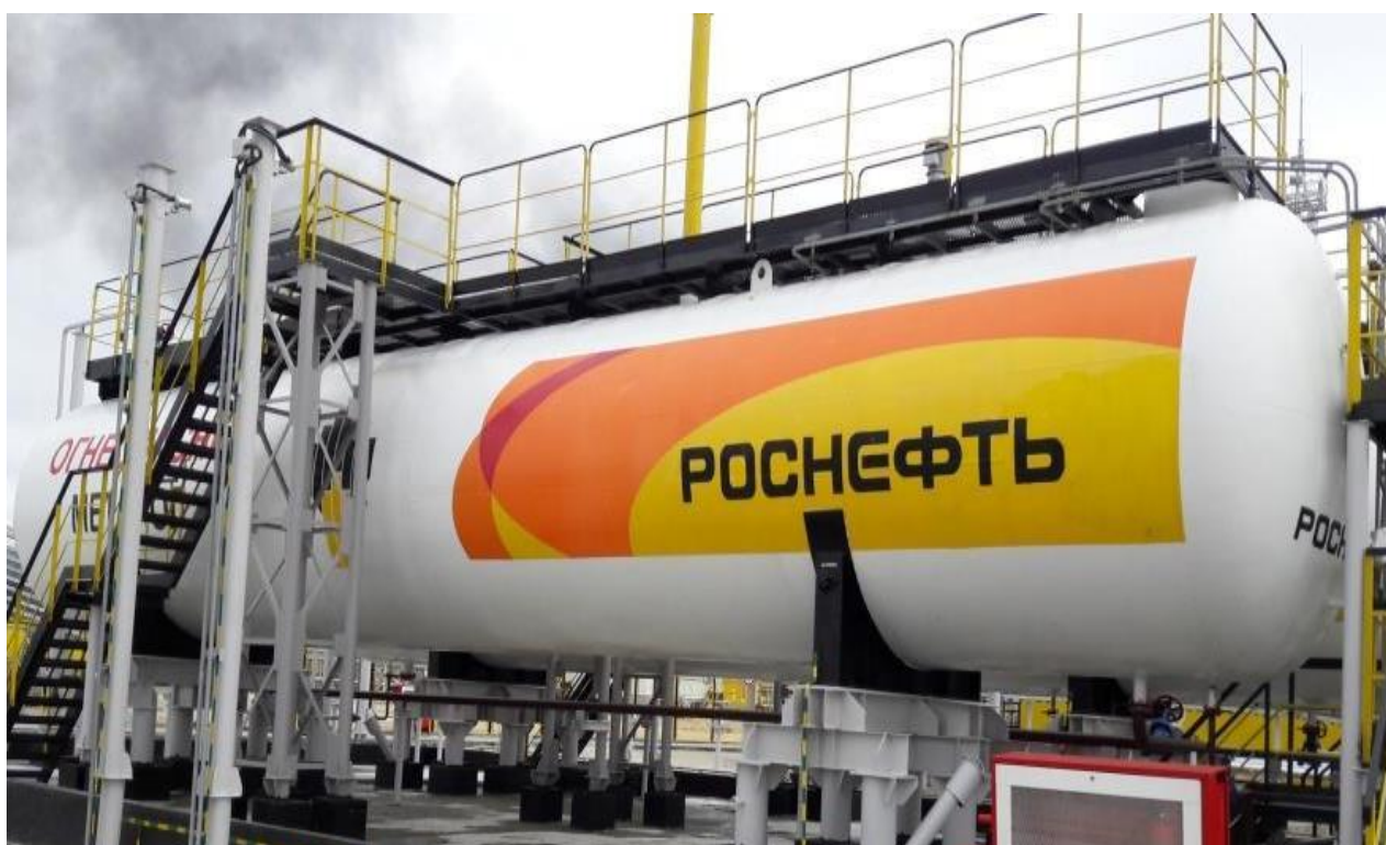
Рисунок 10 – Общий вид резервуара стального горизонтального цилиндрического РГС-200