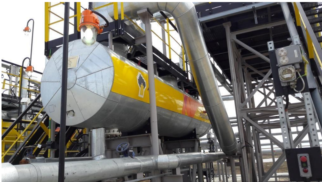
Рисунок 1 – Общий вид резервуара стального горизонтального цилиндрического РГС-6,3