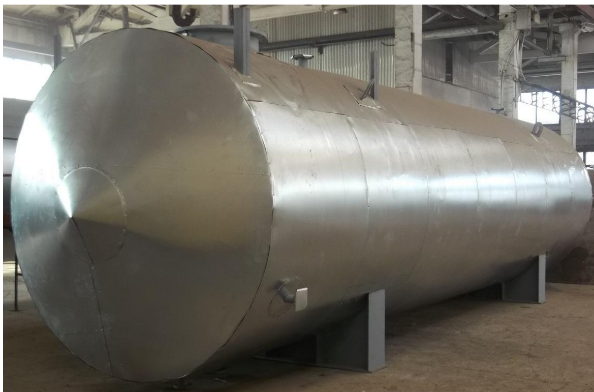
Рисунок 6 – Общий вид резервуара стального горизонтального цилиндрического РГС-40