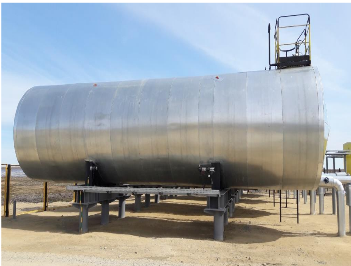
Рисунок 9 – Общий вид резервуара стального горизонтального цилиндрического РГС-100