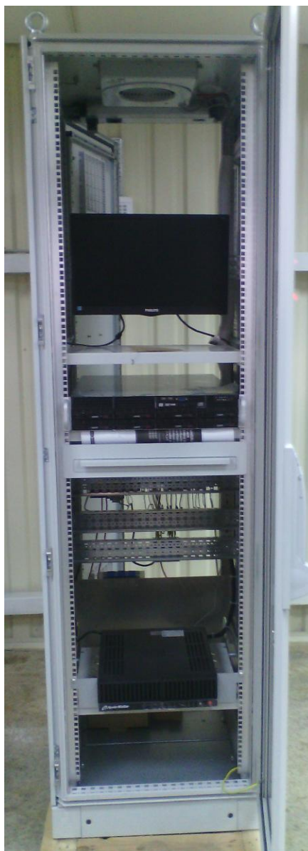
Рисунок 1 – Общий вид шкафа автоматизированного рабочего места

Общий вид системы представлены на рисунках 1 и 2.