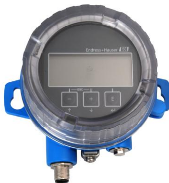
Рисунок 2 - Выносной блок индикации и управления FHX50

Измерительная информация может передаваться в виде аналогового и/или цифрового сигнала (HART, Profibus-PA, Foundation Fieldbus) в измерительный преобразователь, контроллер, персональный компьютер, устройство индикации и регистрации и/или может быть считана с дисплея уровнемера. При необходимости вместо встроенного дисплея может быть использован выносной блок индикации и управления FHX50 (рис. 2).