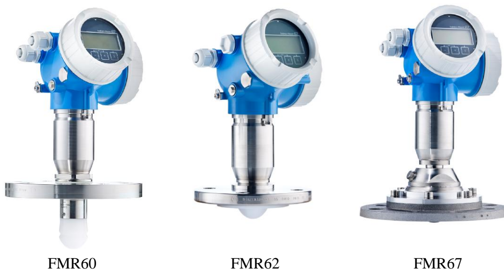
Рисунок 1 - Общий вид уровнемеров Micropilot FMR6x.

Уровнемер монтируется над поверхностью измеряемой среды. В зависимости от конструктивного исполнения антенны и функциональных возможностей электронного преобразователя выпускаются различные исполнения уровнемеров (рис.1), предназначенные для установки в открытом пространстве, резервуарах, аппаратах различной формы и/или в волноводах (измерительных колодцах, выносных камерах и др.).