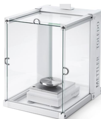
Рисунок 6 - X10003SC