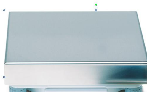
Рисунок 8 - X32003LD5C, X64002LC