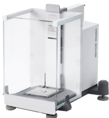
Рисунок 3 - X205CDR, X505C