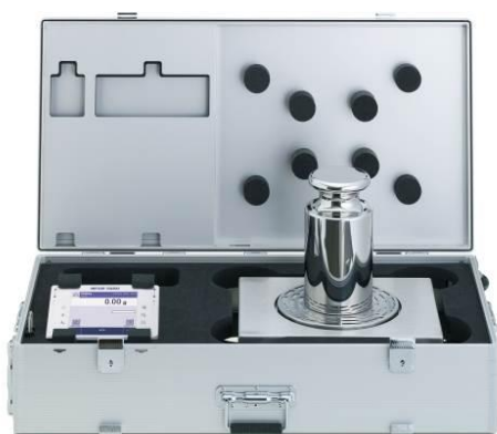
Рисунок 9 - X64002LC-T