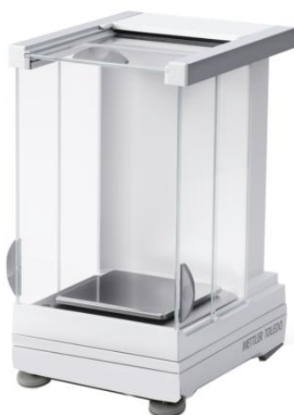
Рисунок 5 - X2003SC