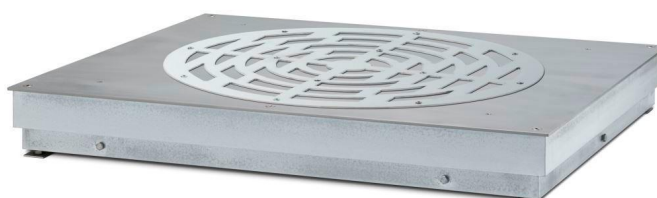
Рисунок 12 - X2003KLC, X6002KLC