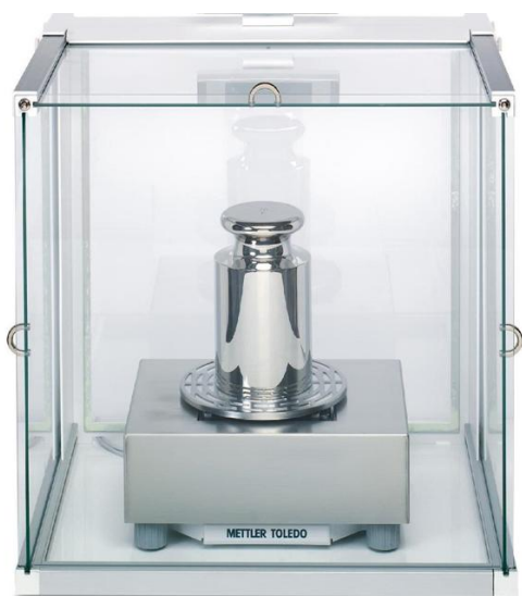
Рисунок 7 - X26003LC, X64003LD5C