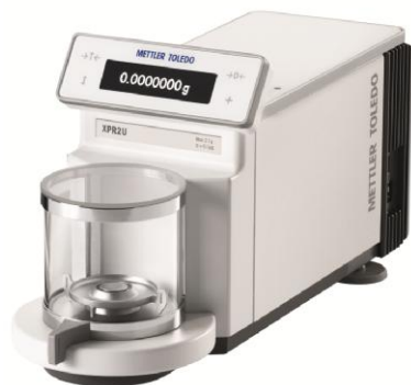
Рисунок 1 - X6U

Общий вид взвешивающих модулей представлен на рисунках 1 - 12.