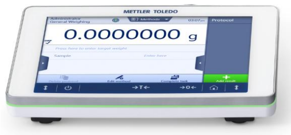
Рисунок 13 - Терминал РР

Общий вид терминалов представлен на рисунках 13 и 14.