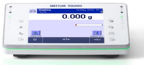
Рисунок 14 - Терминал РЕ

Обозначение исполнения модификаций имеет вид: