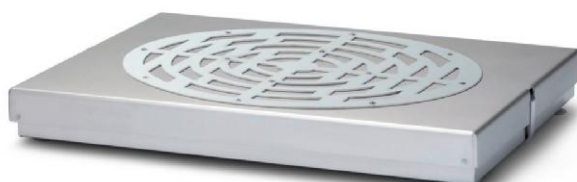
Рисунок 11 - X604KMC, X1003KMC