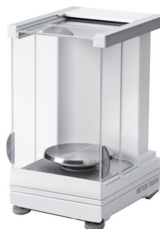
Рисунок 4 - X2004SC, X5003SC, X5004SD5C