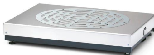
Рисунок 10 - X155KSC