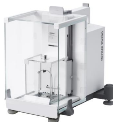
Рисунок 2 - X26C, X56C