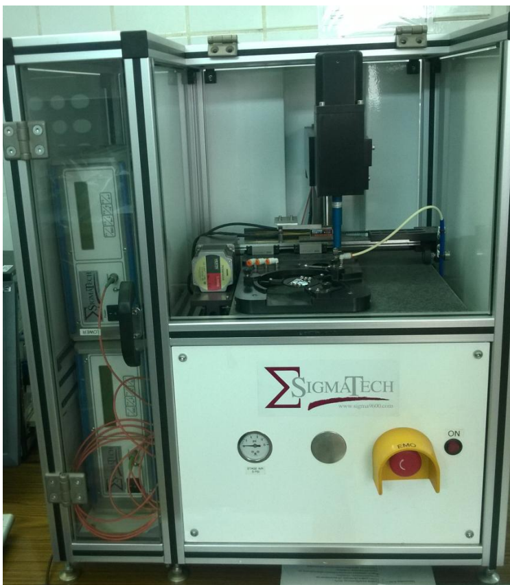
Рисунок 1 - Общий вид установки для измерения толщины UltraMap S100-FP