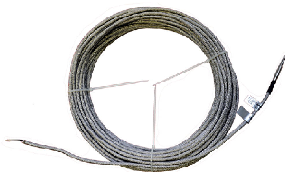
Рисунок 2 - Общий вид термопреобразователей сопротивления серии KLW-LZP модификации KLW-LZP