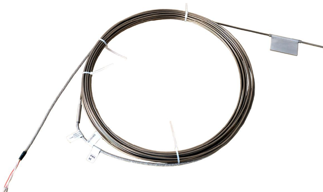
Рисунок 4 - Общий вид термопреобразователей серии S-LZP модификации SLW-LZP