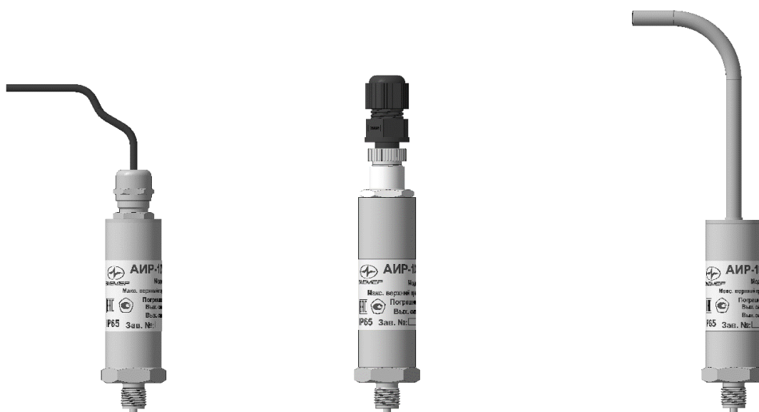
а) общепромышленное, взрывозащищенное (Ex) исполнения преобразователей