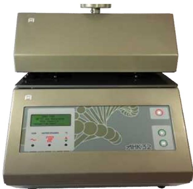
Рисунок 1 - Общий вид устройства АНК