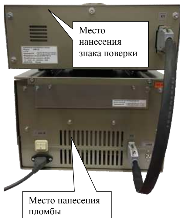
Рисунок 2 - Схема пломбировки от несанкционированного доступа, обозначение места нанесения знака поверки для устройства АНК