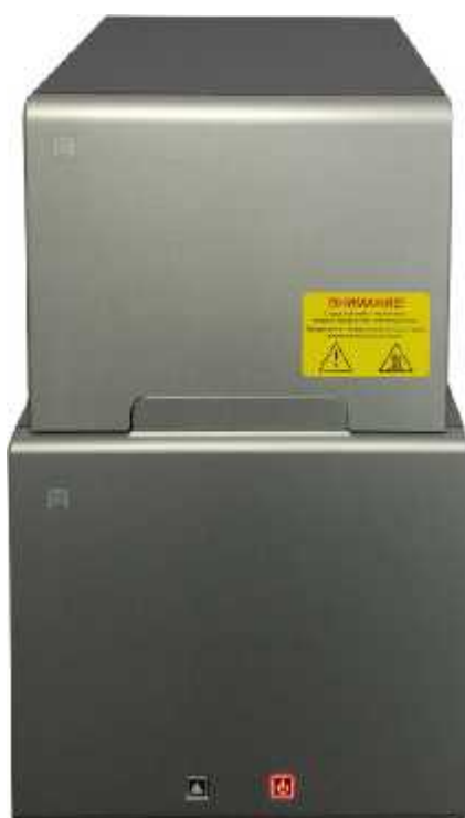
Рисунок 3 - Общий вид устройства АНК-М