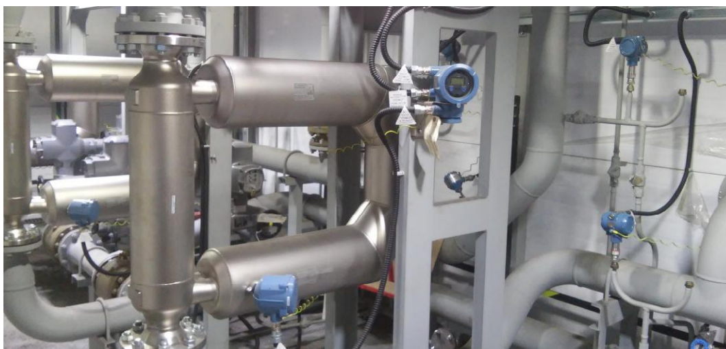
Рисунок 1 - Общий вид ПУ