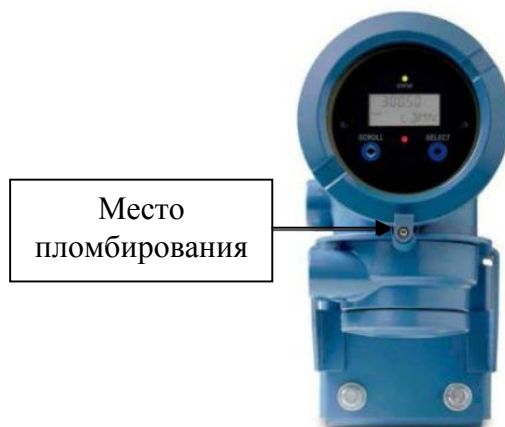
Рисунок 3 - Места установки знака поверки (пломбирования) на преобразователе модели 2700R11AFGEZZZ