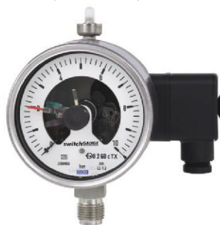
Модификации PGS23, PGS26