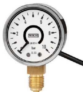
Модификации PGS06, PGS07, PGS25, PGT10, PGT11, PGT21