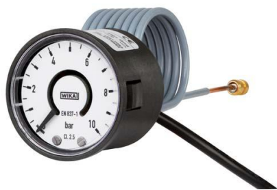
Модификации PGS05, PGT02