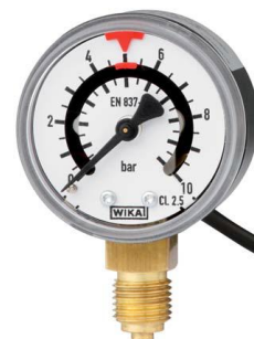
Модификации PGS10, PGS11