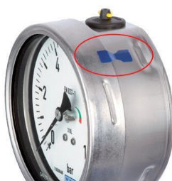
Рисунок 6 - Пример пломбирования манометров нанесением на кольцо и боковую поверхность корпуса специальной наклейки