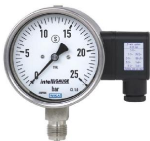
Модификации PGT23, PGT26