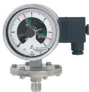
Модификации PGS43, PGS43HP