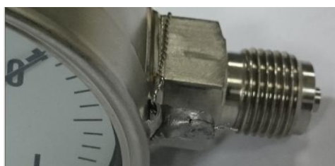
Рисунок 5 - Пример пломбирования манометров продеванием контровочной проволоки и навешивания свинцовой или пластиковой пломбы.

Место нанесения знака поверки манометров представлено на рисунке 7.