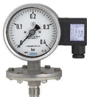
Модификации PGT43, PGT43HP