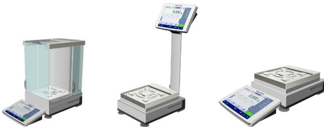
Рисунок 1б - Общий вид весов с действительной ценой деления d=1 мг; Условное обозначение взвешивающего модуля: 303, 603, 1203, 3003, 5003, 6003