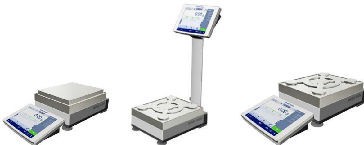
Рисунок 1в - Общий вид весов с действительной ценой деления d=10 мг;