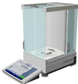
Рисунок 1а - Общий вид весов с действительной ценой деления d=0,1 мг; Условное обозначение взвешивающего модуля: 204, 404, 504

Общий вид весов показан на рисунках 1а-1д.