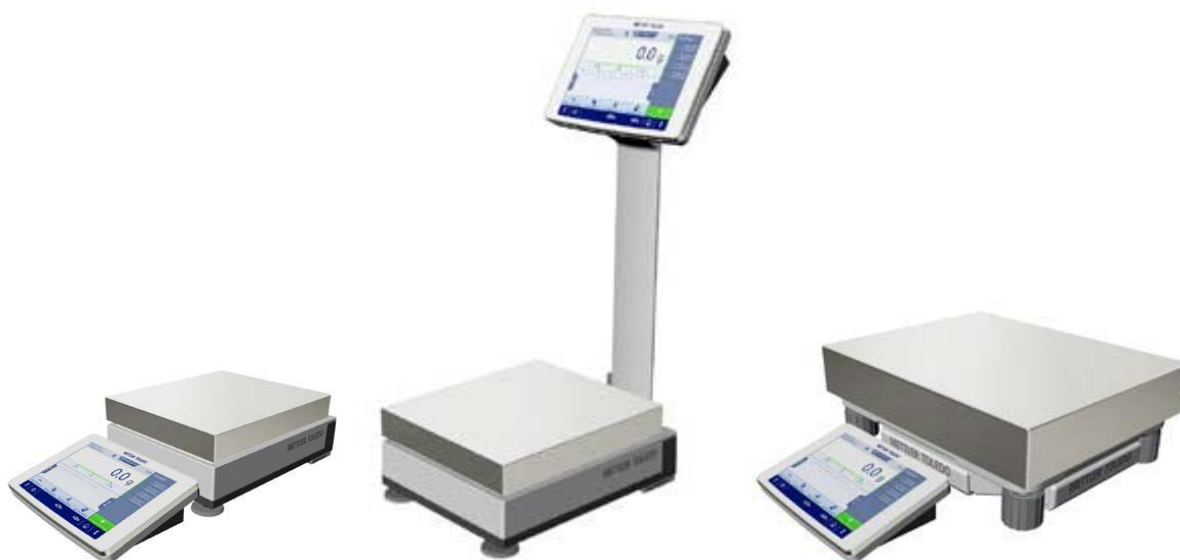
Рисунок 1д - Общий вид весов с действительной ценой деления d=0,1 г; Условное обозначение взвешивающего модуля: 4001, 6001, 8001, 10001, 16001, 32001, 64001