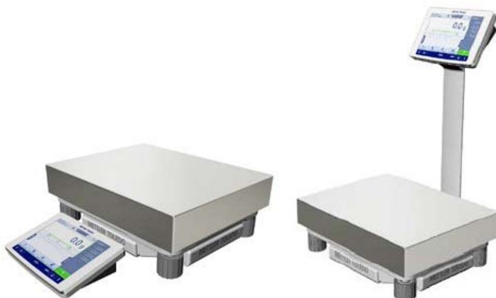
Рисунок 1е - Общий вид весов с действительной ценой деления d=1 г; Условное обозначение взвешивающего модуля: 16000, 32000, 64000