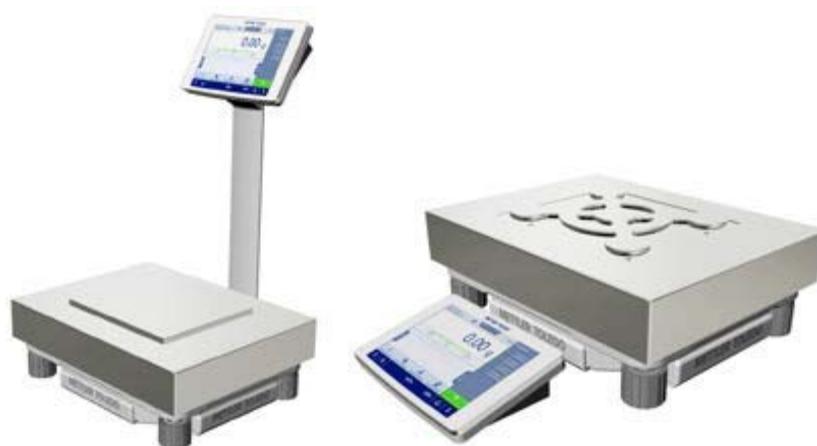
Рисунок 1г - Общий вид весов с действительной ценой деления d=10 мг; Условное обозначение взвешивающего модуля: 15002, 20002

Условное обозначение взвешивающего модуля: 1202, 2002, 4002, 6002, 8002, 10002