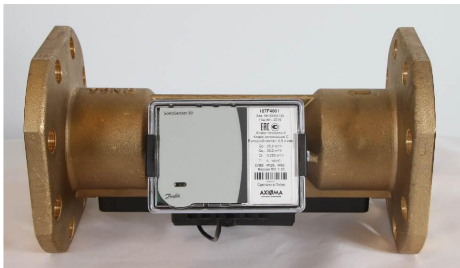
Рисунок 1 - Общий вид преобразователя ультразвукового SonoSensor 30

Общий вид преобразователя представлен на рисунке 1.