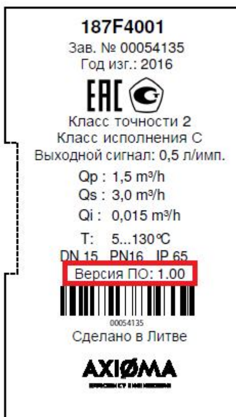
Рисунок 4 - Место нанесения номера версии на передней панели прибора

Уровень защиты ПО от непреднамеренных и преднамеренных изменений в соответствии с Р 50.2.077-2014 - высокий.