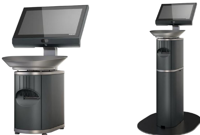
Рисунок 1 - Внешний вид средства измерений (слева настольная версия, справа версия, размещенная на стойке)

Общий вид средства измерений представлен на рисунке 1.