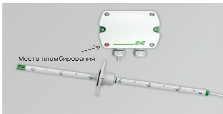
Рисунок 1 - Общий вид модели ЕЕ650

Общий вид измерителей и мест их пломбирования представлен на рисунках 1 - 11. Пломбирование осуществляется нанесением специальной метки на винт, защищающий от внешнего вмешательства к деталям, от которых зависит работа датчика. В качестве метки может выступать краска или бумажная мембрана.