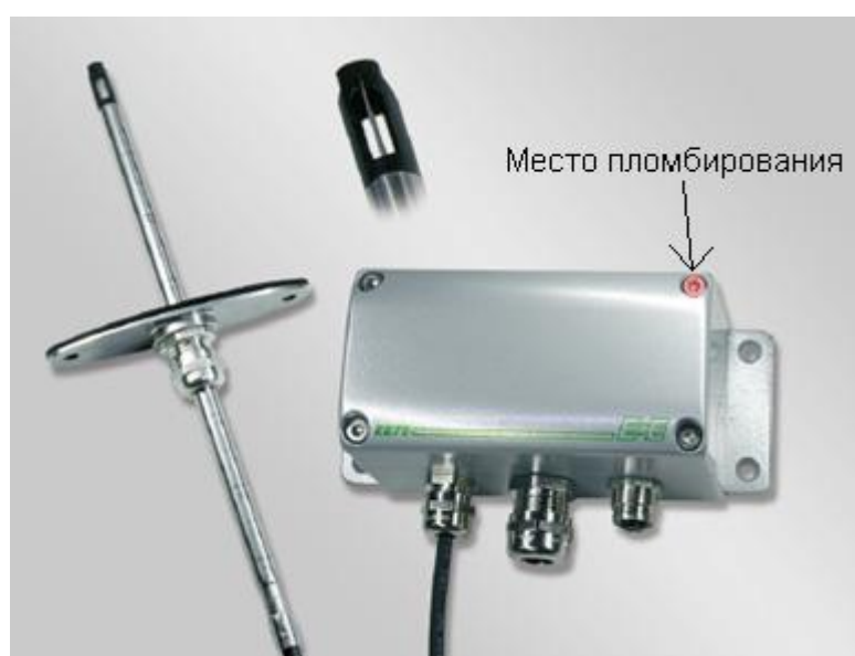
Рисунок 2 - Общий вид модели EE75