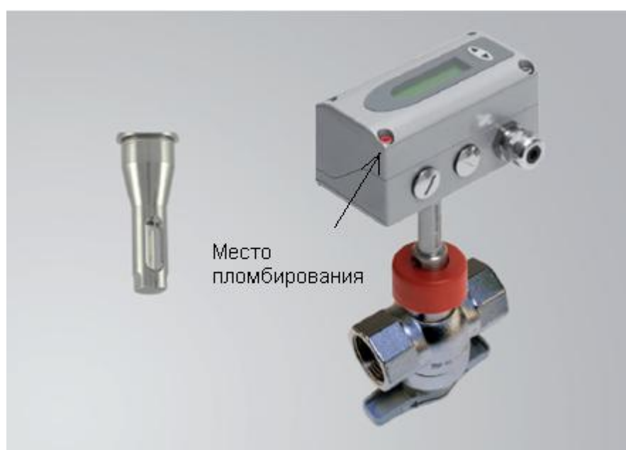
Рисунок 8 - Общий вид модели EE771