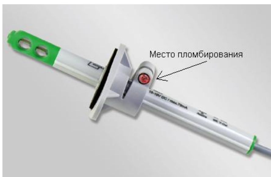
Рисунок 3 - Общий вид модели EE576