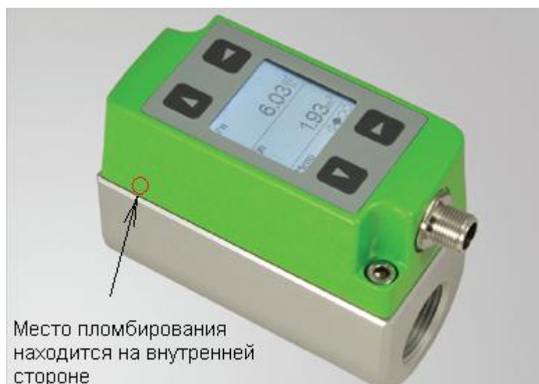
Рисунок 11 - Общий вид модели EE741