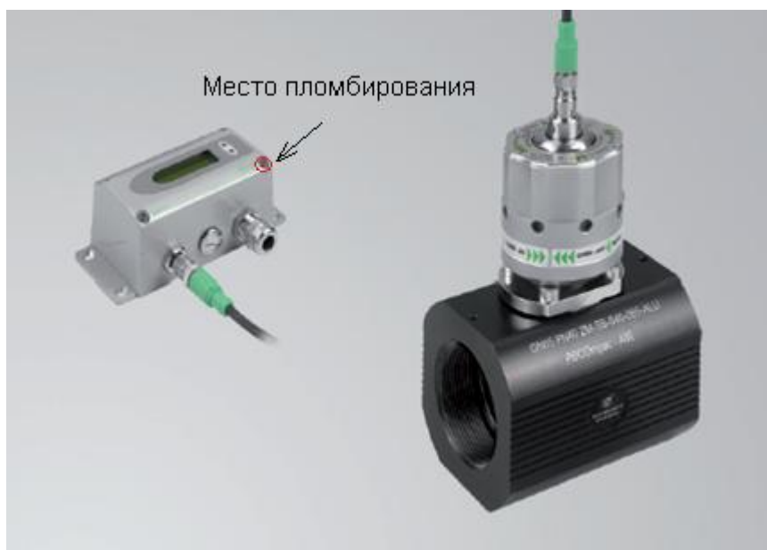
Рисунок 9 - Общий вид модели EE772