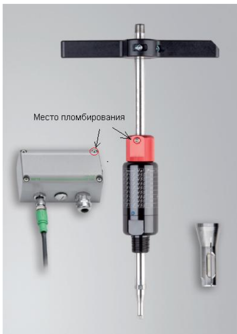
Рисунок 10 - Общий вид модели EE776