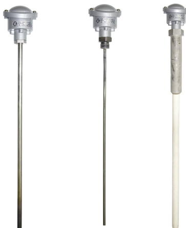
Р и с у н о к 1 – Внешний вид

Структура условного обозначения представлена в таблице 1.