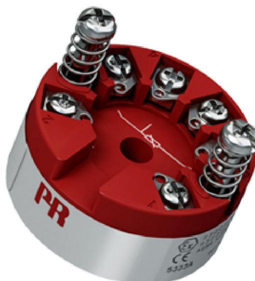
Рисунок 4 - Общий вид преобразователей измерительных серии PR модификаций 5331, 5333, 5334, 5335, 5337, 5343, 5350