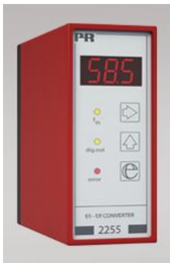
Рисунок 1 - Общий вид преобразователей измерительных серии PR модификаций 2224, 2231, 2255, 2261, 2286, 2289

Фотографии общего вида преобразователей приведены на рисунках 1-11.