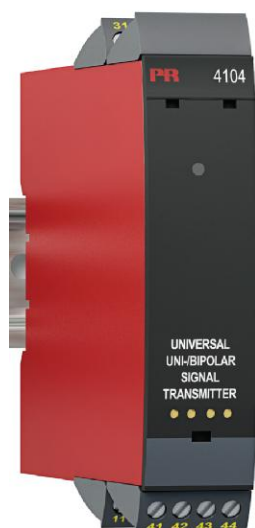
Рисунок 3 - Общий вид преобразователей измерительных серии PR модификаций 4104, 4114, 4116, 4131, 4222