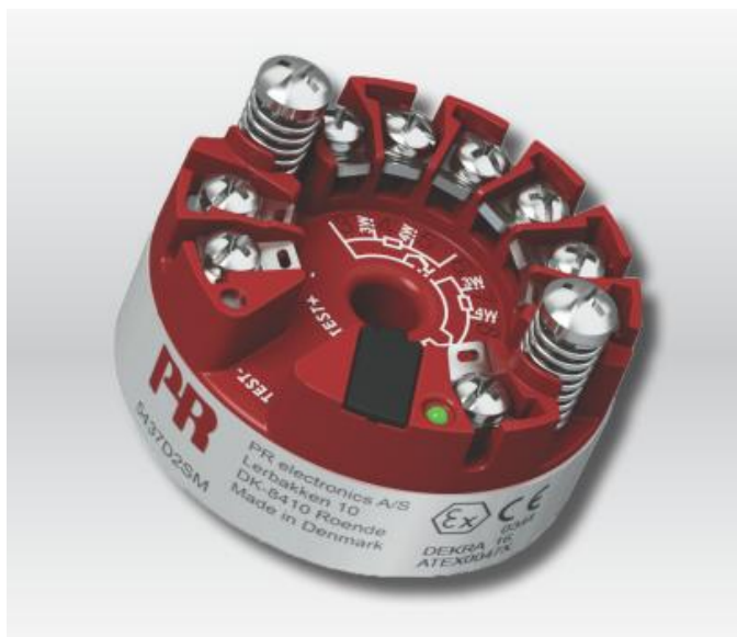
Рисунок 11 - Общий вид преобразователей измерительных серии PR модификаций 5437

Пломбирование преобразователей измерительных PR не предусмотрено.