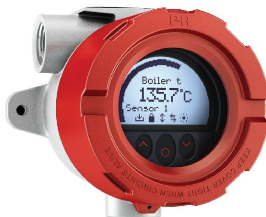
Рисунок 8 - Общий вид преобразователей измерительных серии PR модификации 7501 (выпускается в 2 цветах: красный и синий)