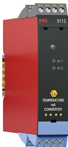
Рисунок 9 - Общий вид преобразователей измерительных серии PR модификаций 9106, 9107, 9113, 9116