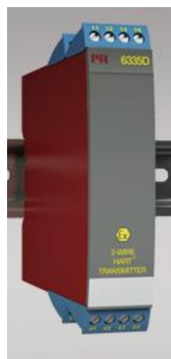
Рисунок 6 - Общий вид преобразователей измерительных серии PR модификаций 6331, 6333, 6334, 6335, 6337, 6350