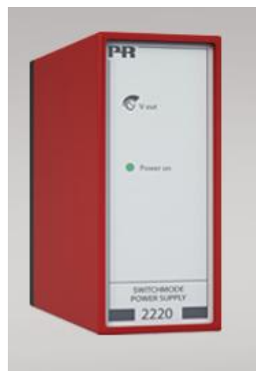
Рисунок 10 - Общий вид преобразователей измерительных серии PR модификаций 2204, 2279, 2284