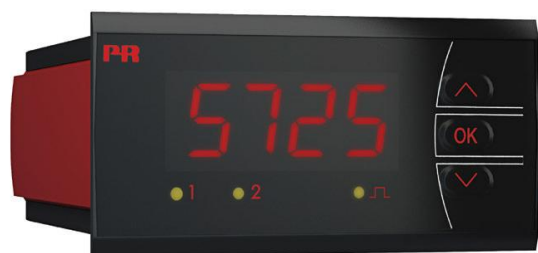
Рисунок 7 - Общий вид преобразователей измерительных серии PR модификаций 5531, 5714, 5715, 5725