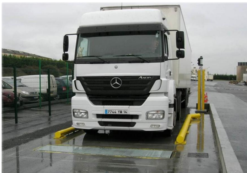
Рисунок 1 - Общий вид систем взвешивания автомобильных транспортных средств RANGE CAPTELS R

Общий вид систем и маркировочная табличка представлены на рисунках 1 и 2.