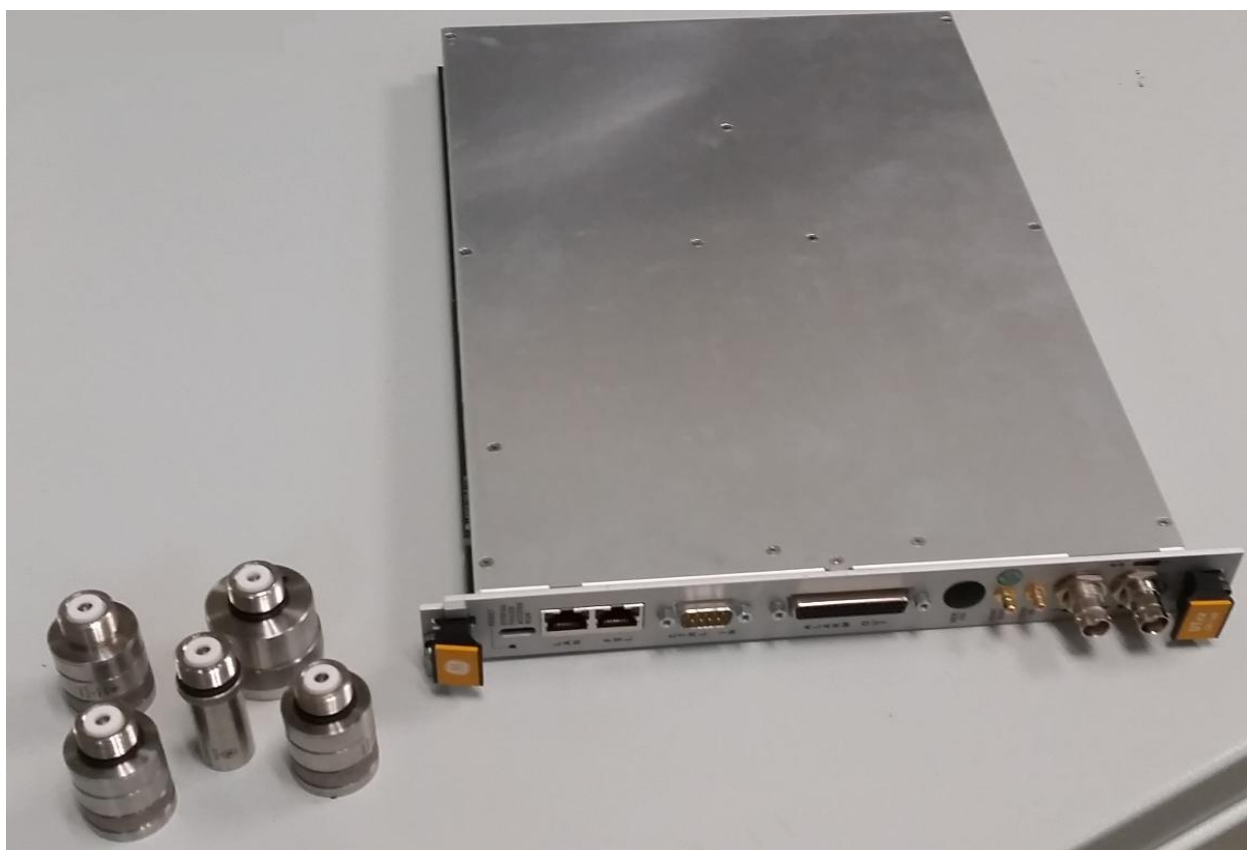
Рисунок 1 - Общий вид системы

Общий вид системы представлен на рисунке 1.