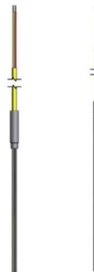
Рисунок 20 - ТС исполнений 113TE06, 114TE06