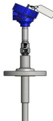
Рисунок 14 - ТС исполнений 111TE06, 112TE05, 215TE09