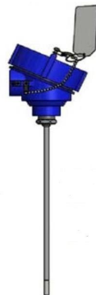
Рисунок 10 - ТС исполнений 111TE07, 112TE06, 111TE09, 112TE08