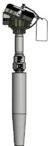
Рисунок 15 - ТС исполнений 111TE13, 112TE12