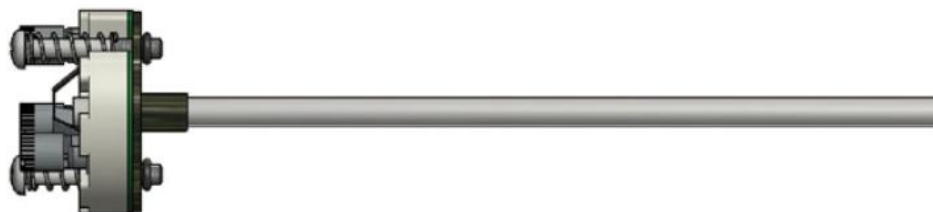
Рисунок 7 - ТС исполнения 112TE02

Чертежи ТС в зависимости от исполнений приведены на рисунках 7-25.