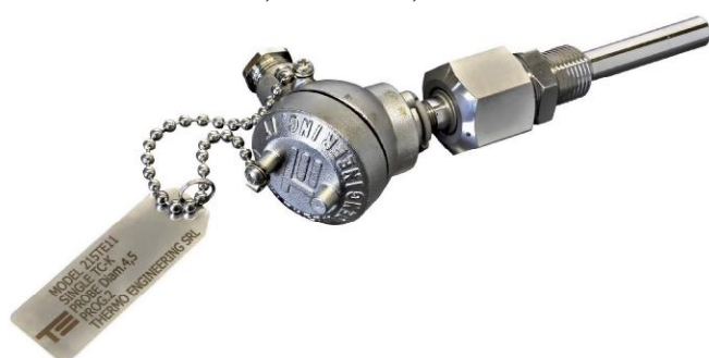
Рисунок 5 - Общий вид ТС исполнений 215TE11