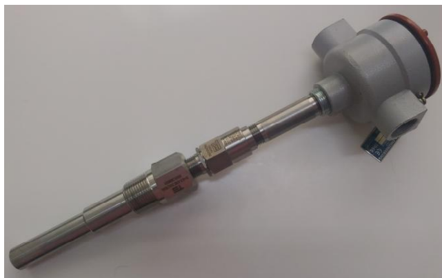
Рисунок 3 - Общий вид ТС исполнений 111TE05, 112TE04, 215TE08