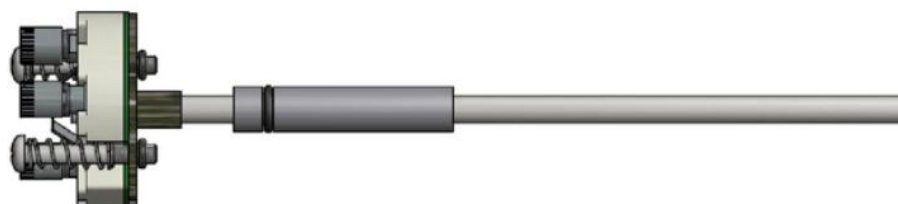
Рисунок 8 - ТС исполнений 111TE02, 111TE03