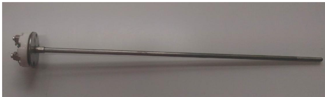
Рисунок 2 - Общий вид ТС исполнения 112TE02