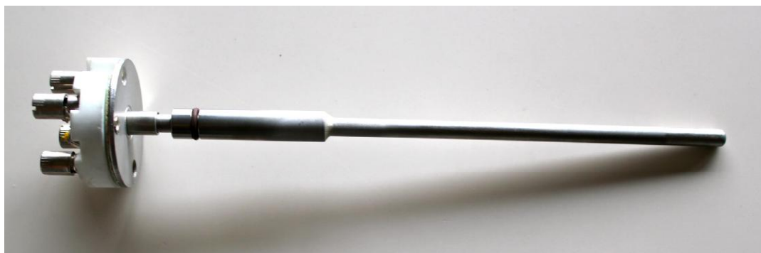
Рисунок 1 - Общий вид ТС исполнений 111TE02, 111TE03

Фотографии общего вида ТС приведены на рисунках 1-6.