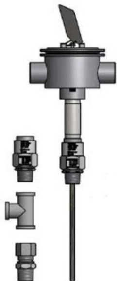
Рисунок 9 - ТС исполнений 111TE04, 112TE03