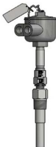
Рисунок 13 - ТС исполнений 111TE05, 112TE04, 215TE08