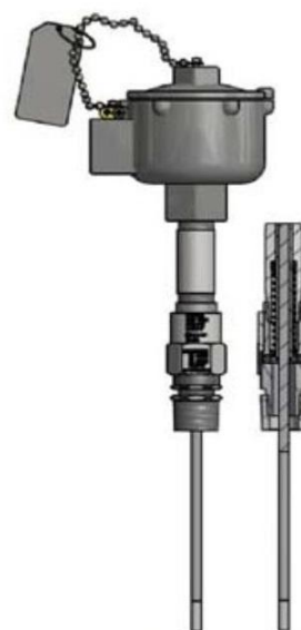
Рисунок 12 - ТС исполнений 111TE10, 112TE09