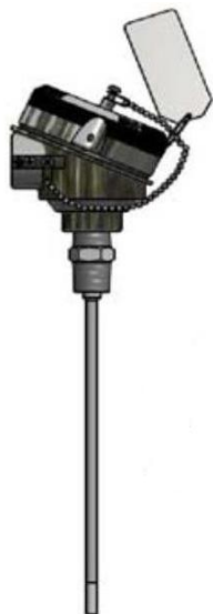
Рисунок 11 - ТС исполнений 111TE08, 112TE07, 111TE09, 112TE08