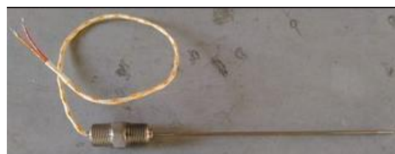
Рисунок 6 - Общий вид ТС исполнений 113TE04, 114TE04, 215TE05

Чертежи ТС в зависимости от исполнений приведены на рисунках 7-25.