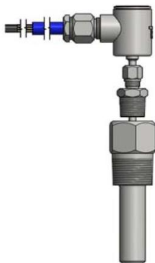
Рисунок 17 - ТС исполнений 113TE03, 114TE03, 215TE10