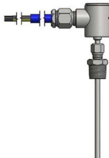
Рисунок 16 - ТС исполнений 113TE03, 114TE03, 215TE10