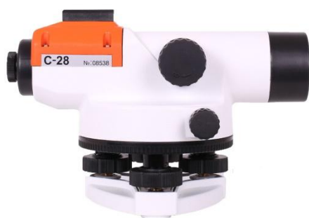
RGK C-20, RGK C-24, RGK C-28

Внешний вид нивелиров с указанием места пломбировки от несанкционированного доступа и места нанесения знака утверждения типа приведен на рисунках 1 и 2.