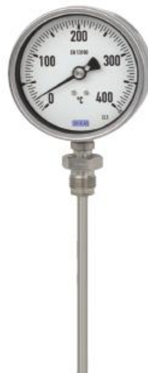
R5526, R5502, R5503, TG55