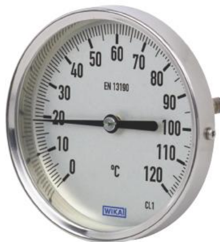
A52.025, A52.033, A52.040, A52.050, A52.063, A52.080, A52.100, A52.160