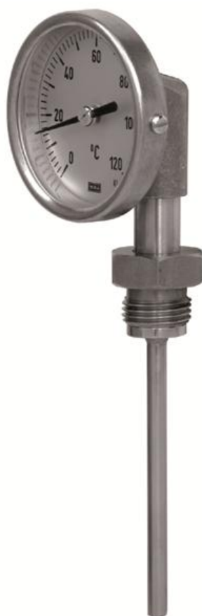
R52.063, R52.080, R52.100, R52.160