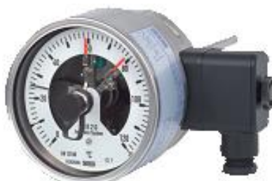
A5525, A5500, A5501, TG55