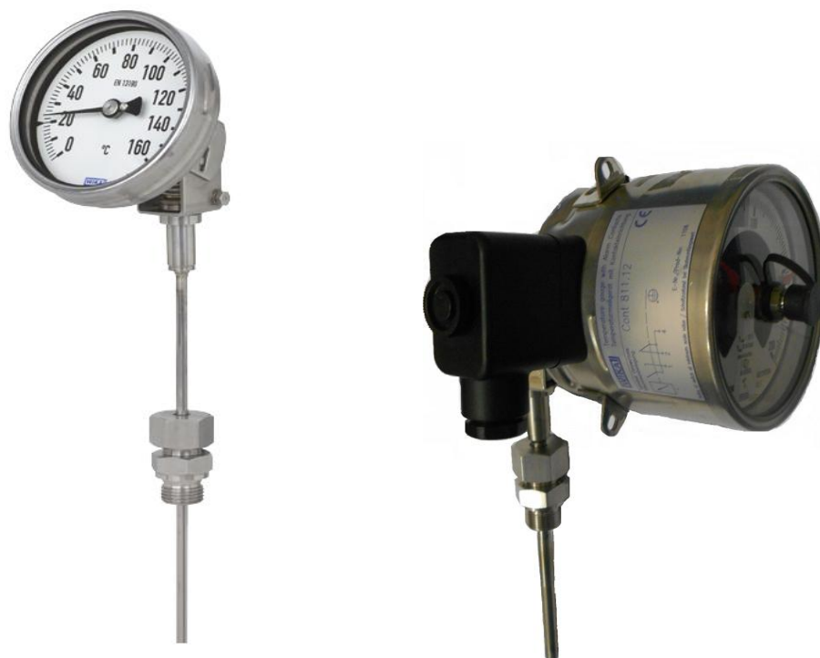
S5500, S5551, TG55