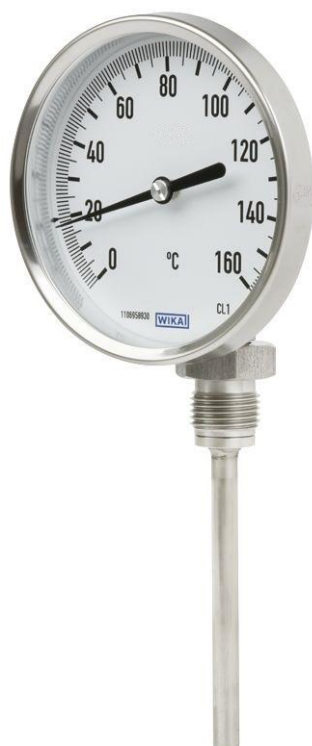
R5440, R5441, R5442, R5443