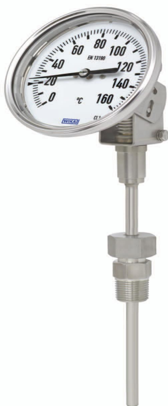
S5410, S5411, S5412, S5413