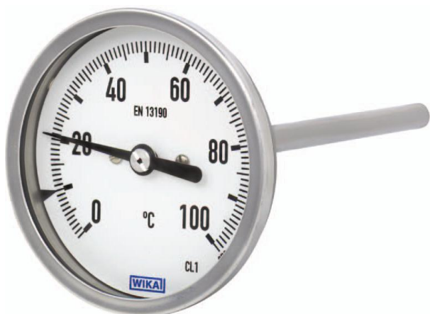
A5400, A5401, A5402, A5403