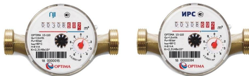
Рисунок 1 - Счетчики ОПТИМА

Общий вид счетчиков представлен на рисунках 1, 2, 3, 4.