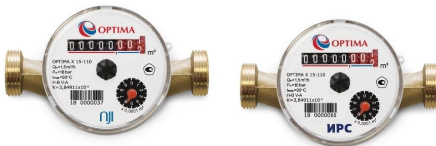
Рисунок 2 - Счетчики ОПТИМА Х