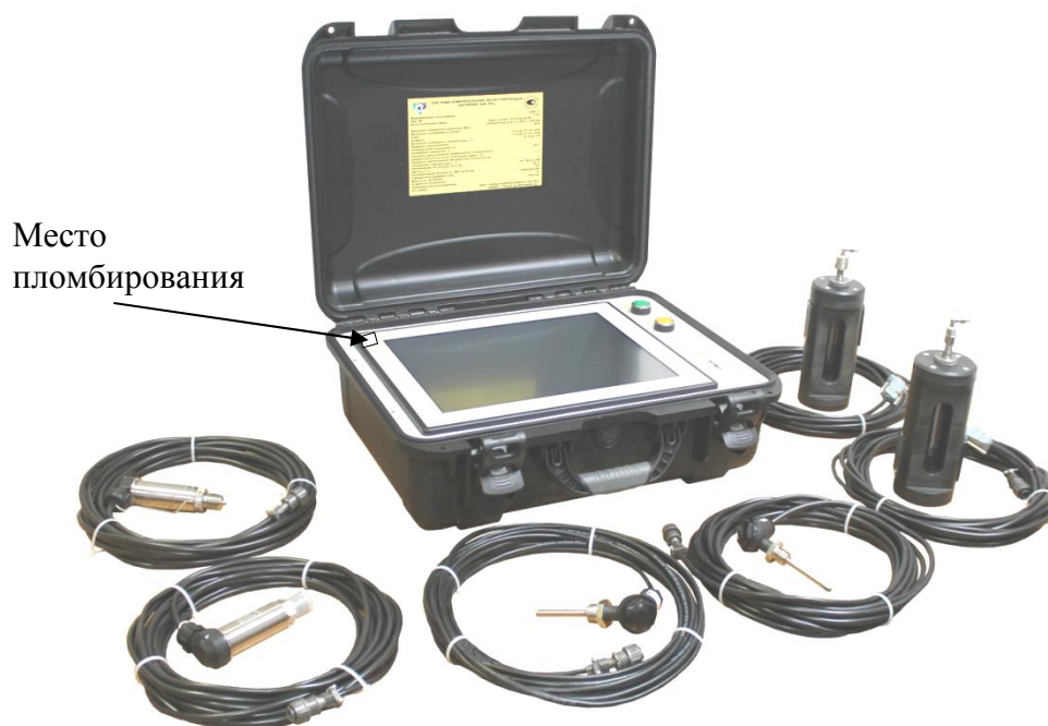
Рисунок 3 - Фотография общего вида модификации II - «Промышленный кейс»

Пломбирование систем от несанкционированного доступа осуществляется путем наклейки с изображением товарного знака предприятия-изготовителя.