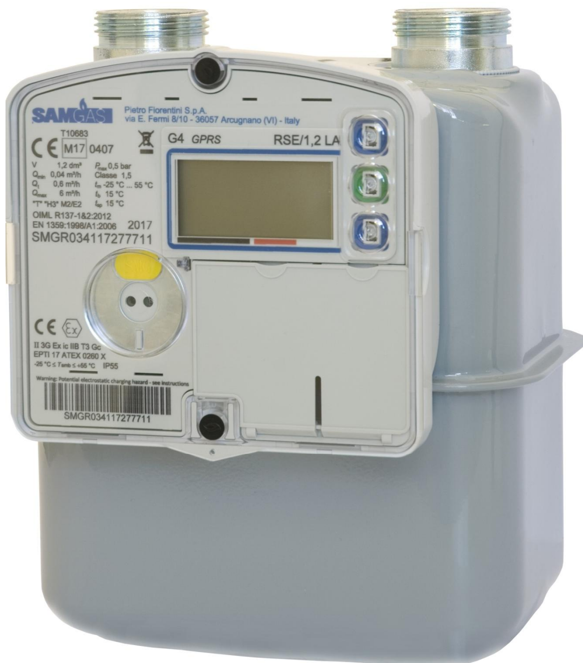
Рисунок 1 - Общий вид счетчика газа объемного диафрагменного RSE

Схема пломбировки для защиты от несанкционированного доступа к элементам конструкции счетчиков, обозначение места нанесения знака поверки представлены на рисунке 2.