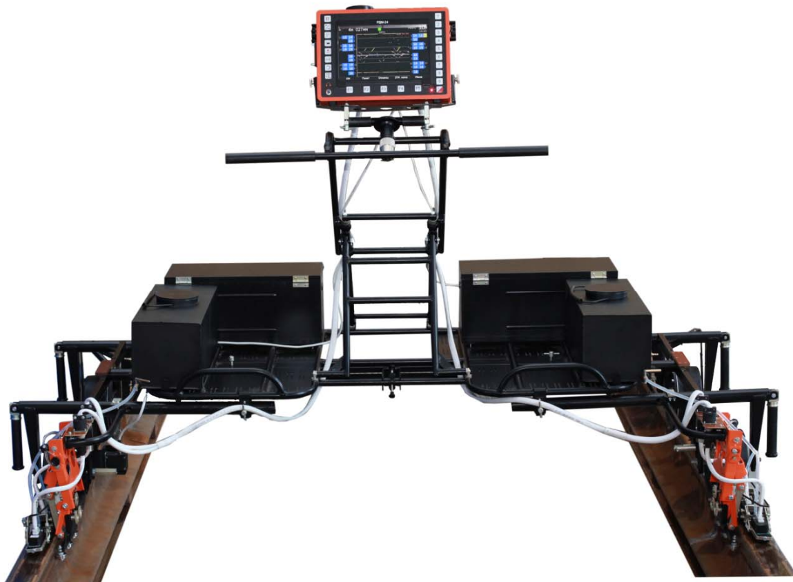
Рисунок 1 - Общий вид дефектоскопов

Общий вид дефектоскопов представлен на рисунке 1.