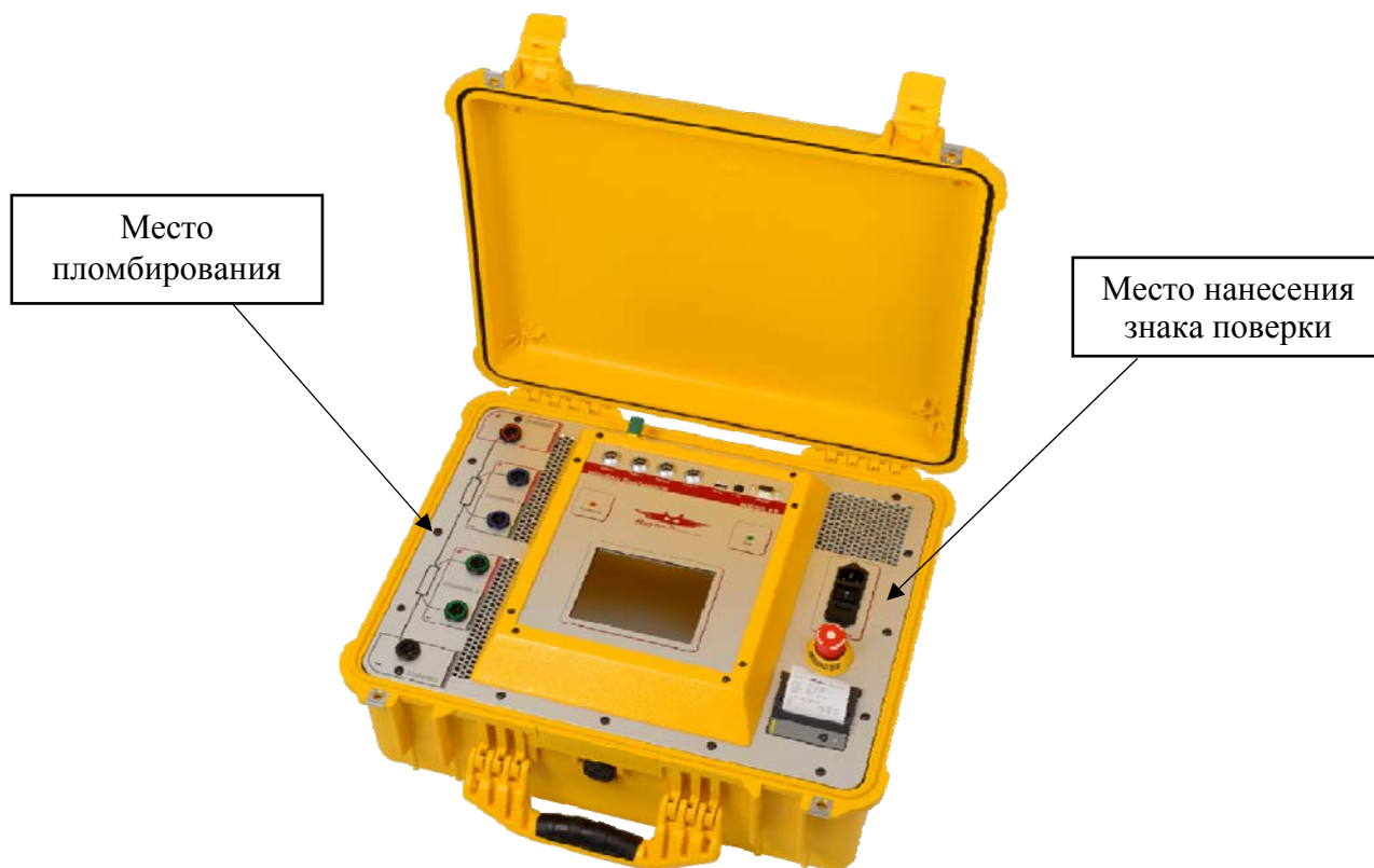
б) модификации WR50-12/13