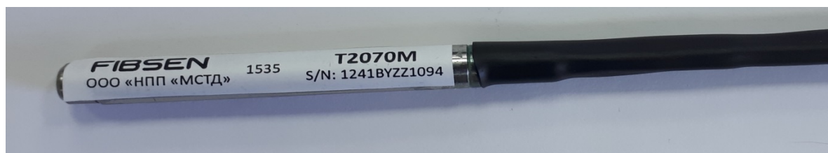
Рисунок 4 - Общий вид датчиков температуры волоконно-оптических T2070M