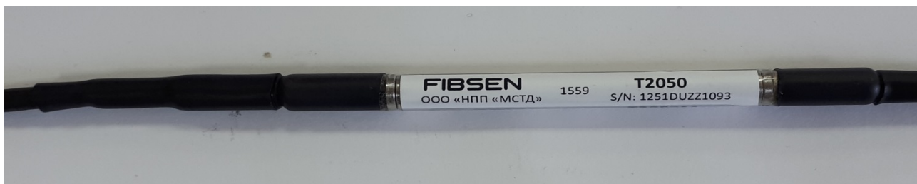
Рисунок 1 - Общий вид датчиков температуры волоконно-оптических T2050

Общий вид датчиков приведен на рисунках 1 - 4.