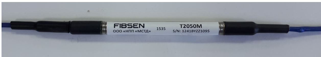
Рисунок 2 - Общий вид датчиков температуры волоконно-оптических T2050M