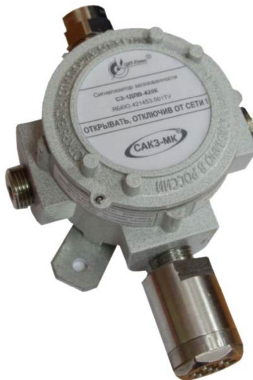
Рисунок 1 - Общий вид сигнализаторов загазованности природным газом СЗ-1ДЛВ-420К